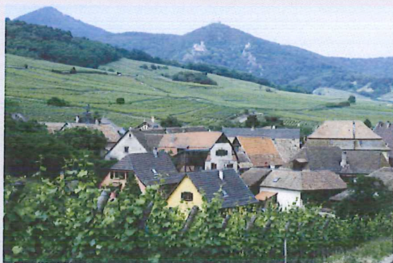
La couleur dans le paysage

« La façade d'une maison n'appartient pas à son propriétaire, mais à celui qui la regarde. »