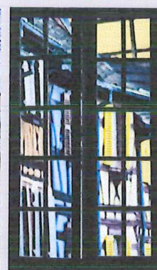
La couleur de chez soi

Le ravalement de façade est un acte participant :