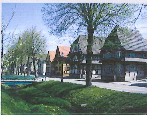
La couleur dans la rue