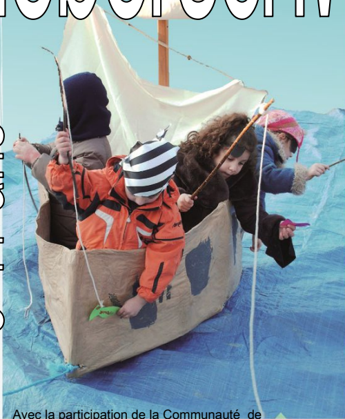
Avec la participation de la Communauté de Communes du Pays de Rouffach, Vignobles et Châteaux